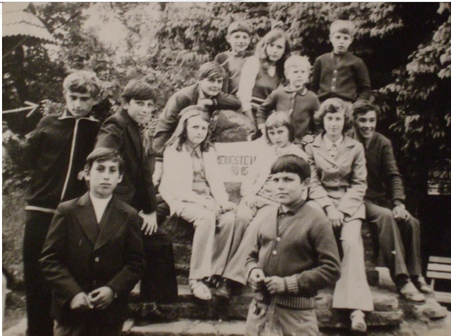
Altalános iskolai kirándulás a Kékes-tetőn, a '70-es években