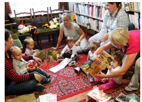
A könyvekkel való ismerkedést nem lehet elég korán kezdeni. Baba-Mama Klub alakult a Könyvtárban.