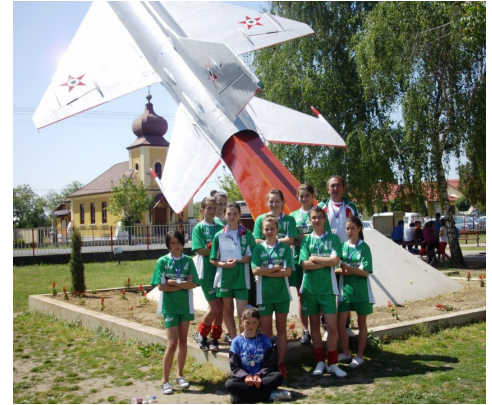
Diáksportolóink a Gyulaházán megrendezett megyei döntő előtt, Farkas Bertalan űrhajós MÍG 21 gépe előtt az iskola udvarán. /További diáksport hírek a 6. oldalon.