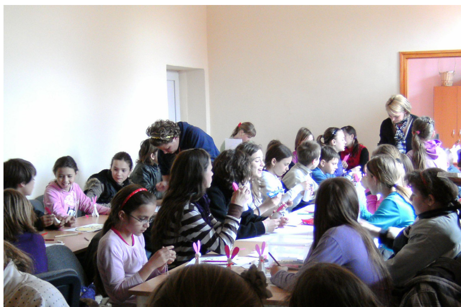
Nagy volt az érdeklődés a fiatalok részéről a kézműves foglalkozás iránt.