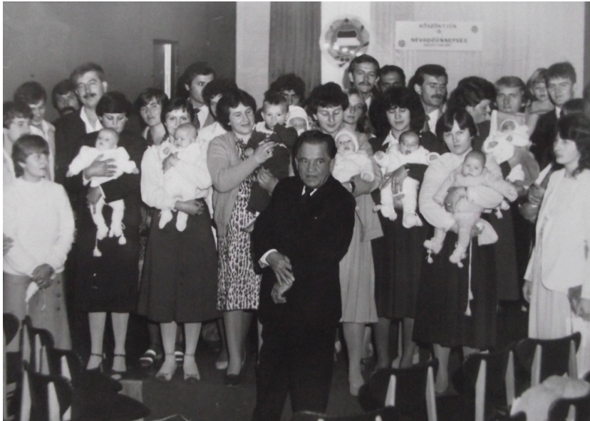
Névadó ünnepség 1984-ben